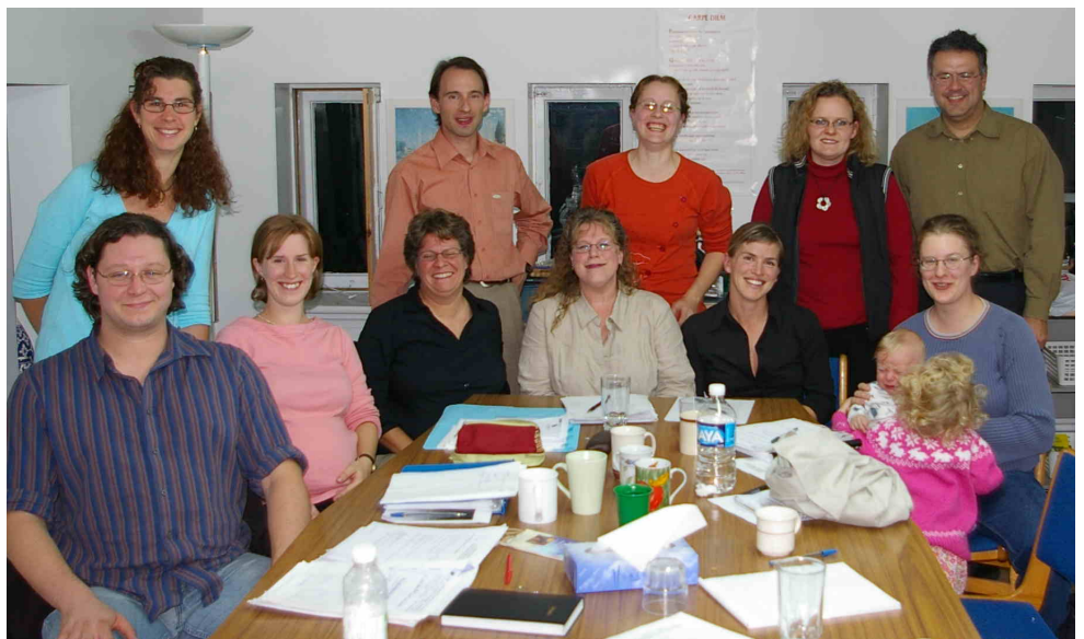
Aux belles heures du Comité de parents Mimosa.