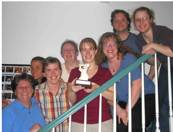
L'équipe qui devrait servir de modèle pour l'ensemble du réseau.

Cette reconnaissance que nous recevons aujourd'hui de l'ASPQ, nous désirons la partager avec les autres comités de parents qui ont travaillé très fort eux aussi depuis de nombreuses années à appuyer la pratique des sages-femmes, à développer des liens communautaires au sein de leur maison de naissance et à faire de celle-ci un lieu de naissance dont les parents sont véritable partie prenante. Nous avons également une pensée solidaire