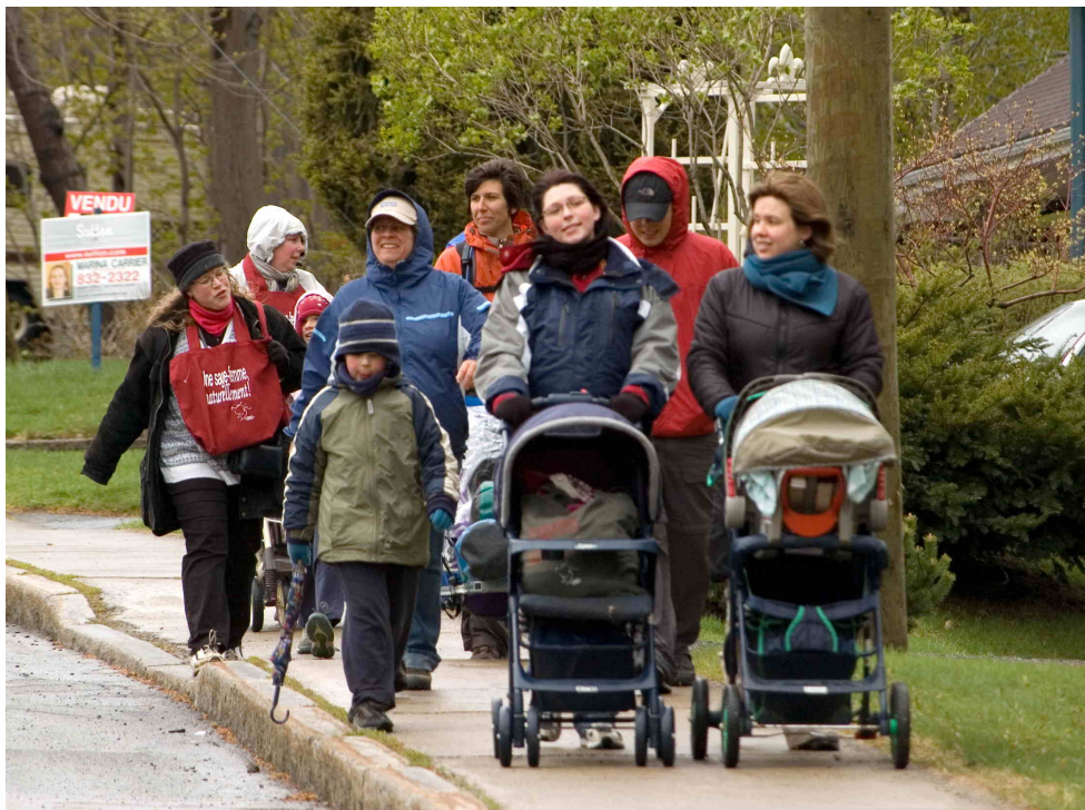
Le CPM regarde droit devant et garde le cap !